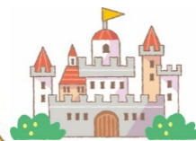
イラスト/鶴田一浩